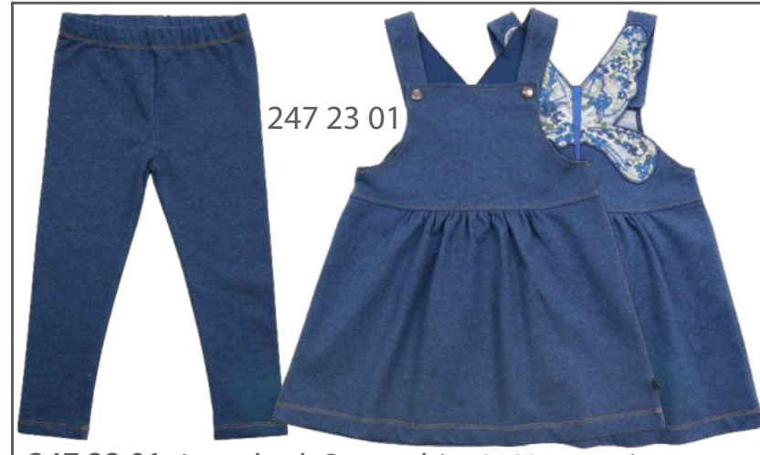
247 22 01 247 23 01 Jeanslook Sweatshirt 95% organic cotton, 5% Elastane GOTS 86/92-158/164