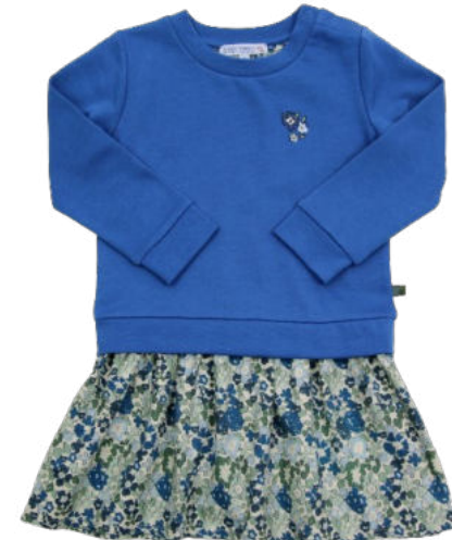
Rockteil aus Flanell