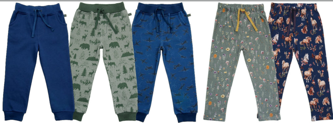
247 20 01 247 20 03 247 20 05 247 21 01 247 21 03 Sweatshirt 100% organic cotton GOTS 86/92-158/164